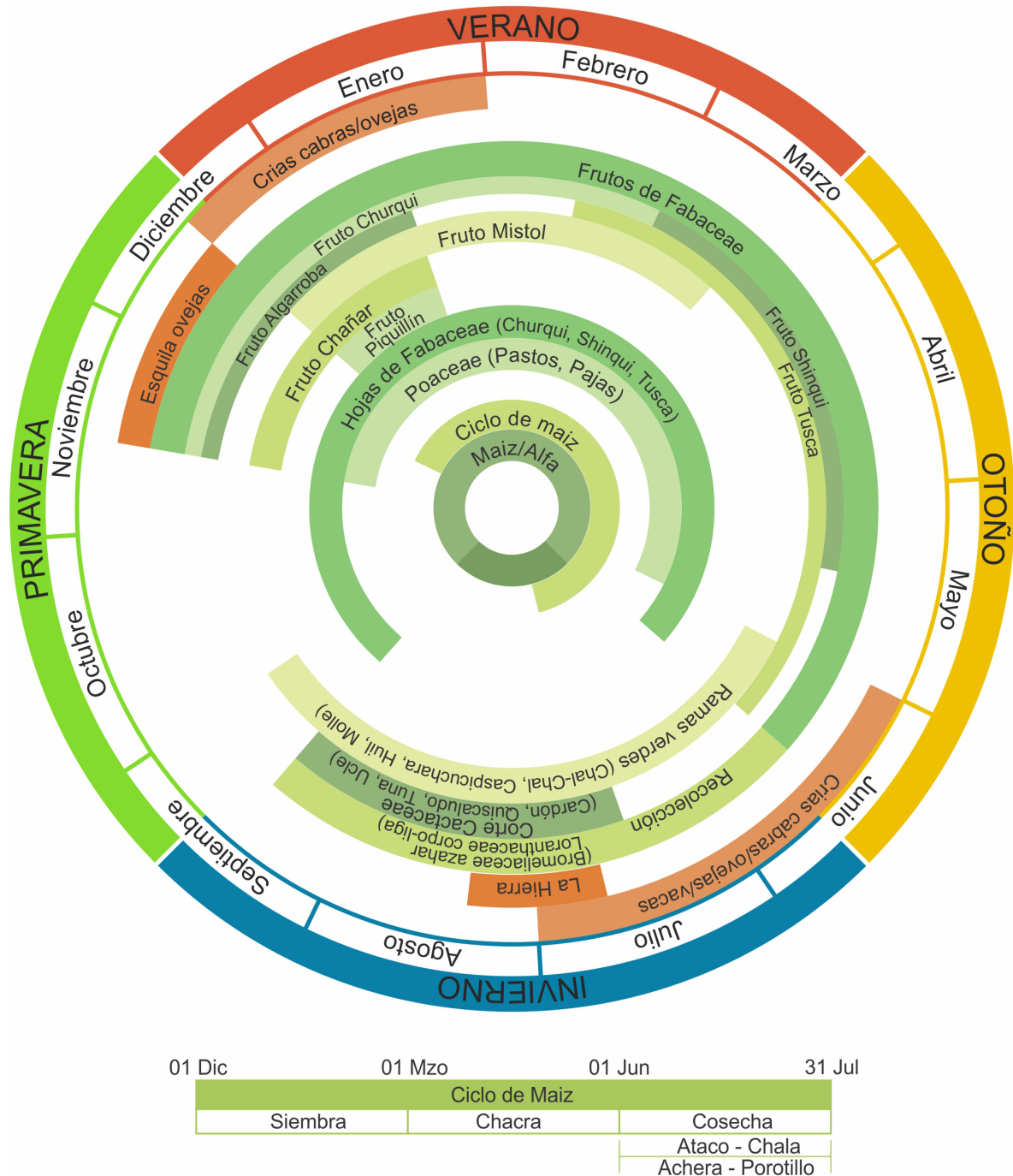
Figura 2. Ciclo anual de los recursos forrajeros en la Sierra de Ancasti, Catamarca, Argentina. Figure 2. Annual cycle of the fodder resources of the Sierra de Ancasti, Catamarca, Argentina.

Cactus para la hambruna (cardón, quiscaludo y ucle): el “cardón” ( Trichocereus terscheckii ) y el “ucle” ( Cereus forbesii ) son especies con tallos columnares y porte arboriforme. Por su parte, el “quiscaludo” ( Opuntia sulphurea ) presenta tallos en artejos y porte rastrero. Estas tres especies de la familia Cactaceae son consideradas como forrajeras y están vinculadas principalmente a la ganadería vacuna. Aunque, las cabras llegan a comer sus