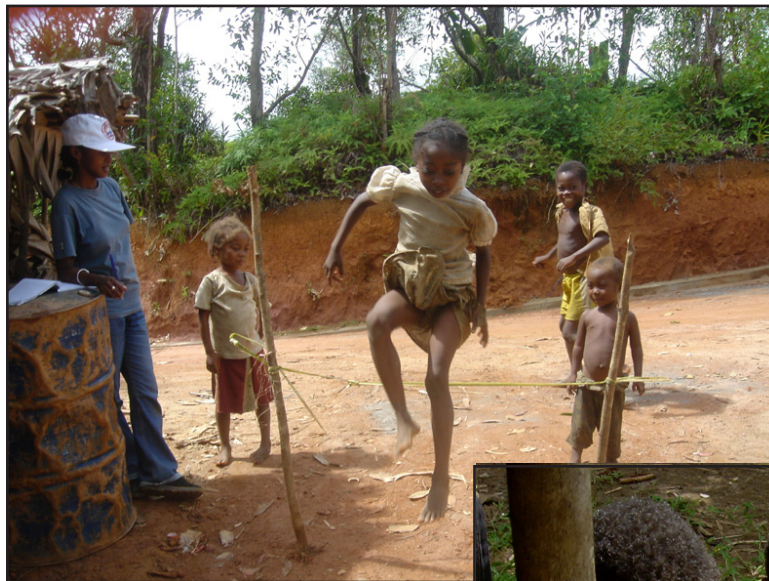
Ankizy manao Korokoko.

Bako mijery ireo ankizy milalao tao Sahamamy (mambokona amin'ny tady.