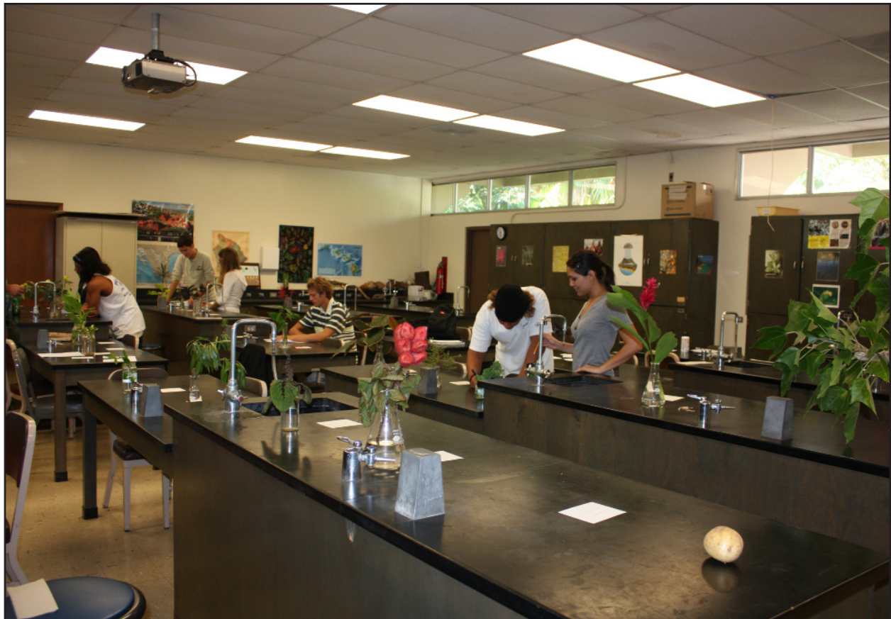
Figura 4. Le piante utilizzate sono le stesse impiegate durante l'esperimento condotto durante il semestre autunnale del 2007 e sono state posizionate nello stesso ordine.

è stato forse quello più impegnativo di tutta l'esercitazione e sono stati osservati diversi comportamenti sociali durante questa parte. Alcuni gruppi hanno mostrato una certa cooperazione egualitaria tra i membri, mentre altri hanno evidenziato chiaramente un certo tipo di comportamenti di leadership emergenti nel gruppo (Figure 14 e 15). Nonostante ciò, è risultato chiaro che questi differenti pattern sociali non hanno significativamente influito sul fatto che siano state usate frequentemente la combinazione sostantivo-aggettivo per dare un nome alle piante e i sostantivi da soli per dare un nome alle categorie (Lau et al. 2009). Questo processo di dare un nome può essere potenzialmente comparato con l'accettazione sociale di un neologismo che viene inizialmente utilizzato da un individuo (o piccolo gruppo) e viene poi diffusamente accettato anche se i due processi possono non essere esattamente la stessa cosa. Dopo che gli studenti hanno completato il processo di categorizzazione delle piante (Figura 16), tutti i dati sono stati organizzati ed analizzati per identificare i modi in cui gli studenti nominano e categorizzano le piante. Infine, tutte le piante sono state preparate come campioni d'erbario (Figura 17) e depositate all'University of Hawai'i Herbarium (HAW).