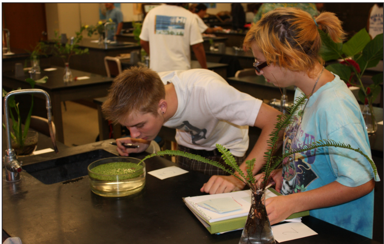
Figura 8. Uno studente annusa un recipiente contenente un campione di piante acquatiche mentre una partner di esercizio osserva.