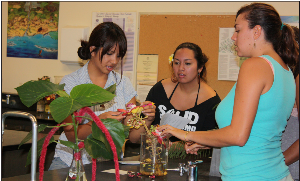
Figura 7. Una studentessa sta esaminando il fiore di una pianta mentre le sue partner di gruppo la osservano.