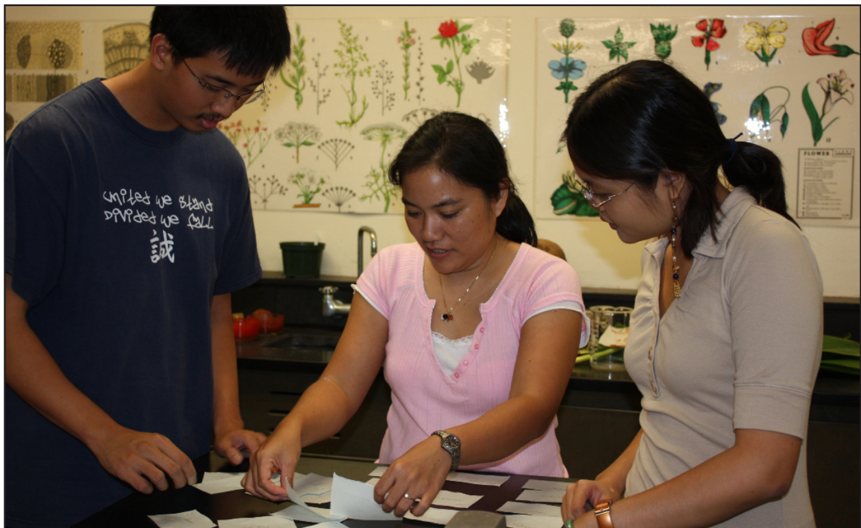
Figura 15. Un certo comportamento di leadership è talvolta emerso durante la fase di categorizzazione dei cartoncini.