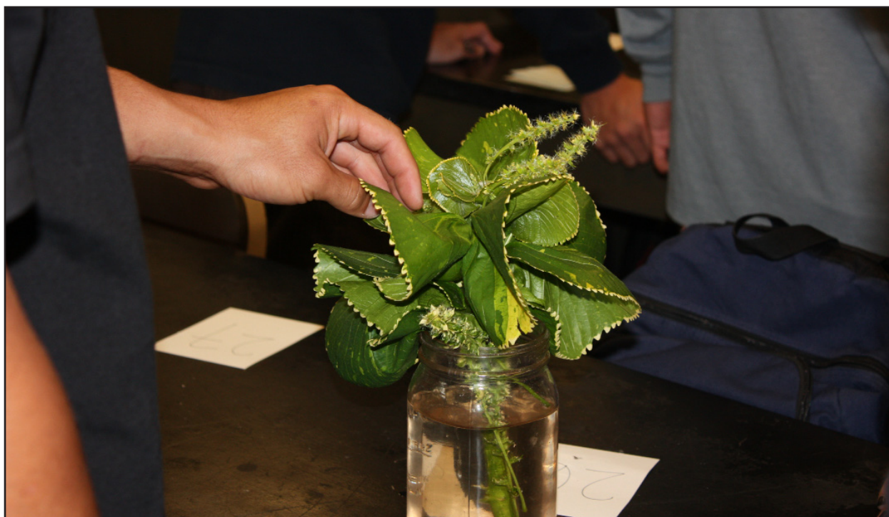
Figura 6. Uno studente sta testando la consistenza della foglia di un campione.