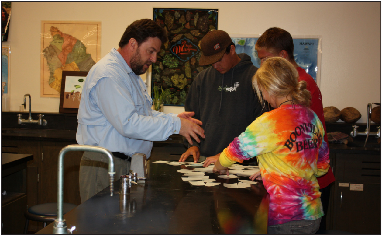
Figura 11. Il docente del corso sta spiegando l'esercizio di classificazione ad un gruppo di studenti.