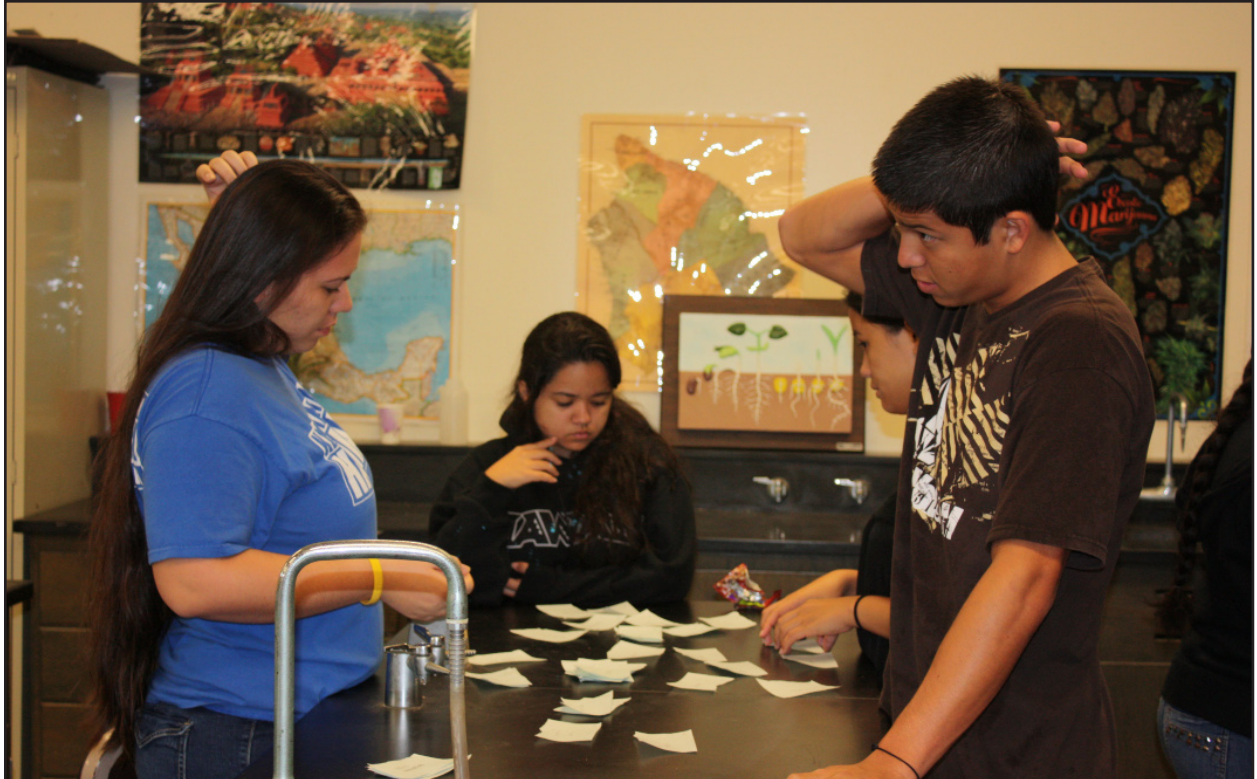
Figura 12. Gli studenti categorizzano le piante in base a similarità e differenze.