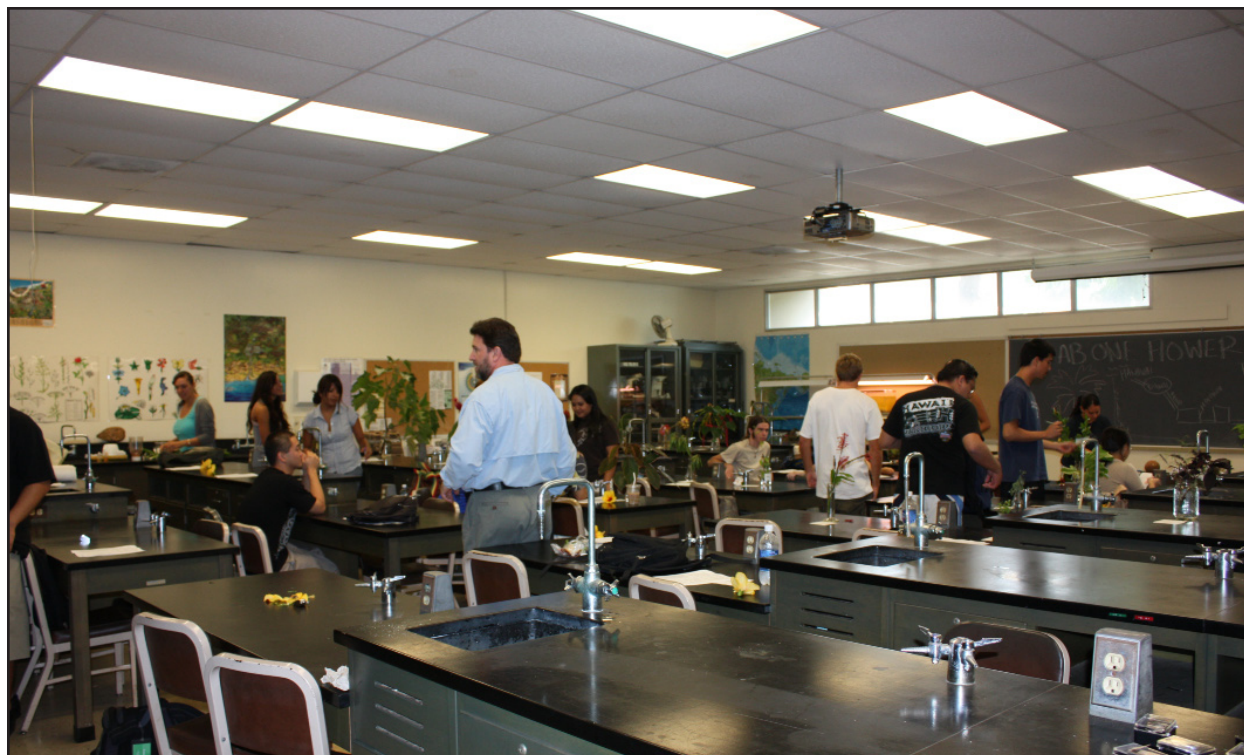
Figura 2. La classe dove è stata condotta l'esercitazione.