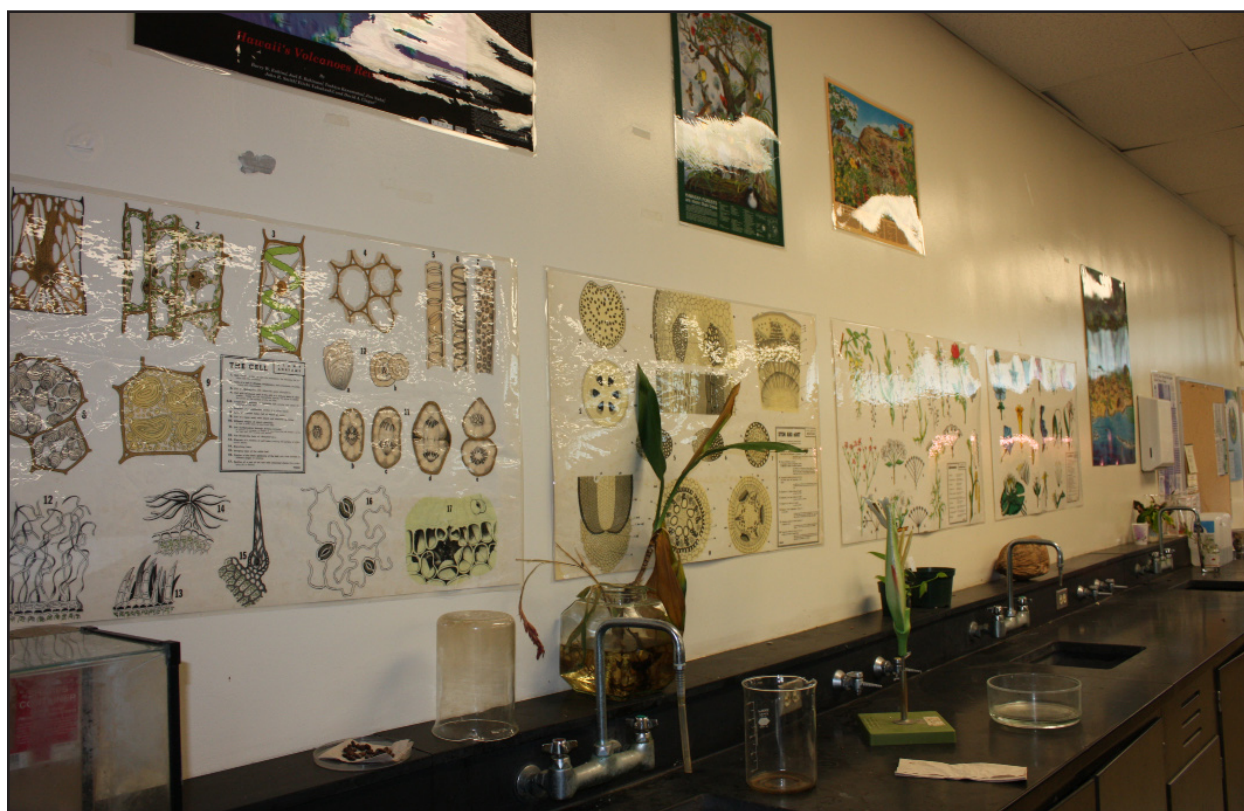
Figura 3. Sulle pareti del laboratorio sono esposti dei poster con informazioni relative alla botanica.