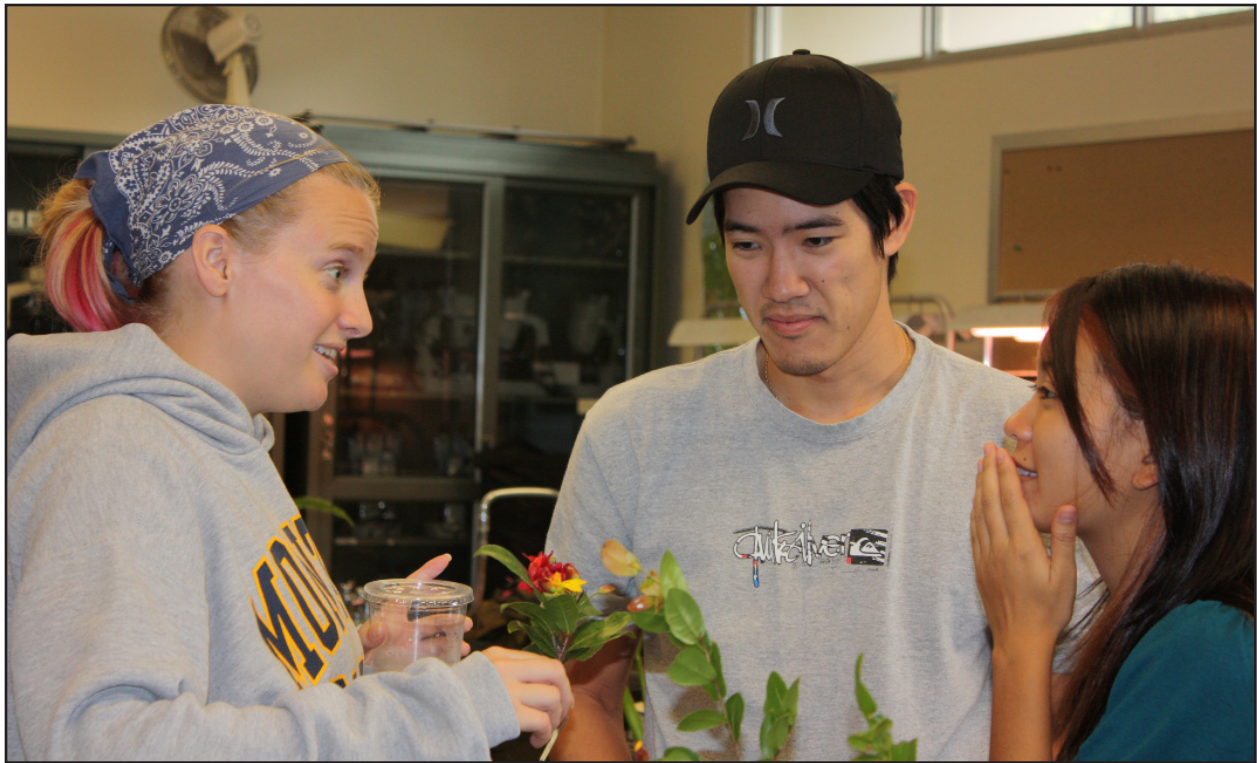
Figura 9. Un gruppo entusiasta di studenti sta discutendo e decidendo il nome per un campione vegetale.