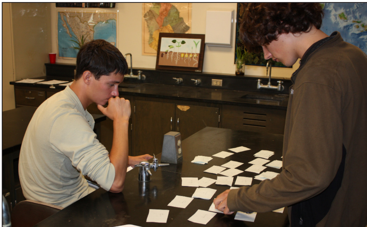
Figura 13. Uno studente è assorto mentre i suoi partner smistano i nomi delle piante in categorie.