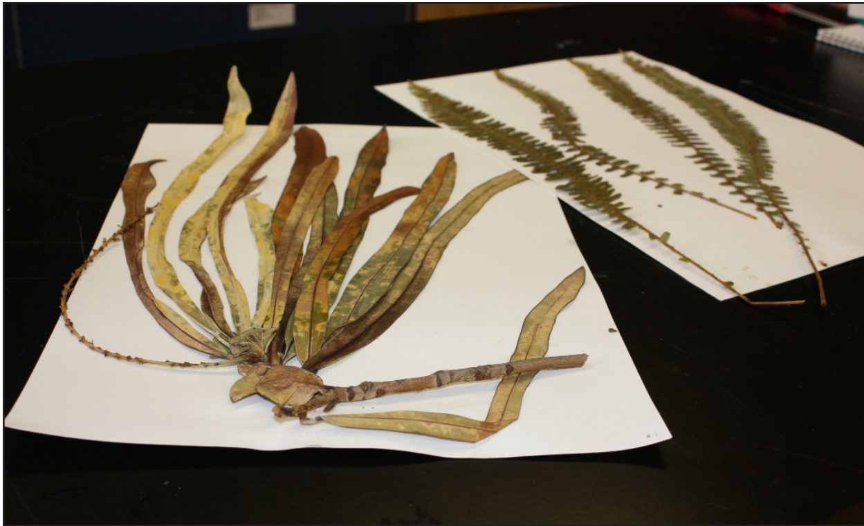
Figura 17. Una pianta che è stata allestita come campione d'erbario per essere depositata all'University of Hawai'i Herbarium (HAW).