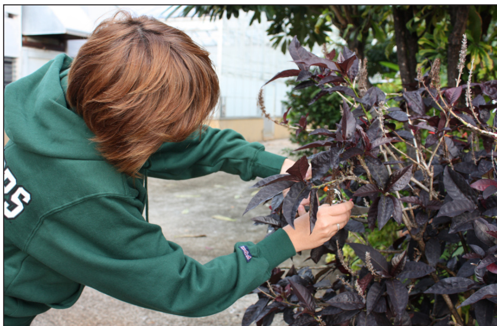
Figura 1. I campioni sono stati raccolti freschi poco prima dell'esercitazione.

Le piante sono state collocate nella stessa identica disposizione utilizzata nell'esperimento svolto nel semestre autun-