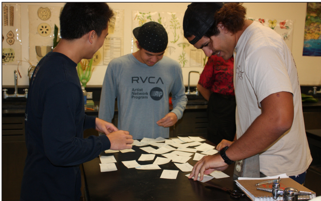
Figura 14. Differenti tipi di comportamenti sociali, come ad esempio discussioni collaborative, sono stati osservati durante l'esercizio di categorizzazione.