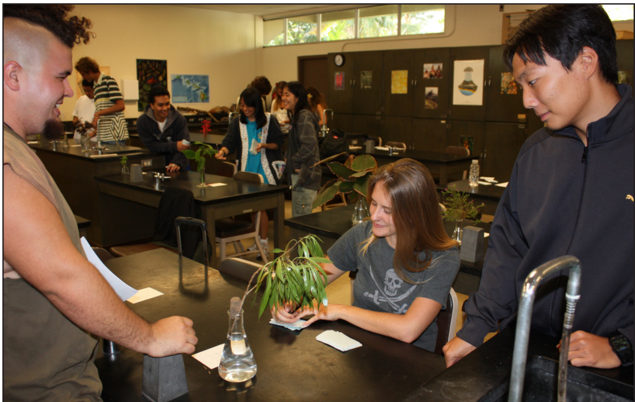
Figura 10. Gli studenti si divertono dando i nomi alle piante.